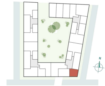
Fischerhof 1 - 25