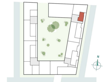
Fischerhof 1 - 25