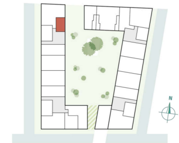
Fischerhof 1 – 25